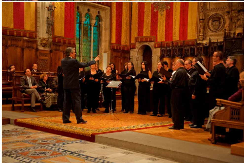
L'Orfeo Laudate, durant l'actuació al Saló de Cent de l'Ajuntament de Barcelona