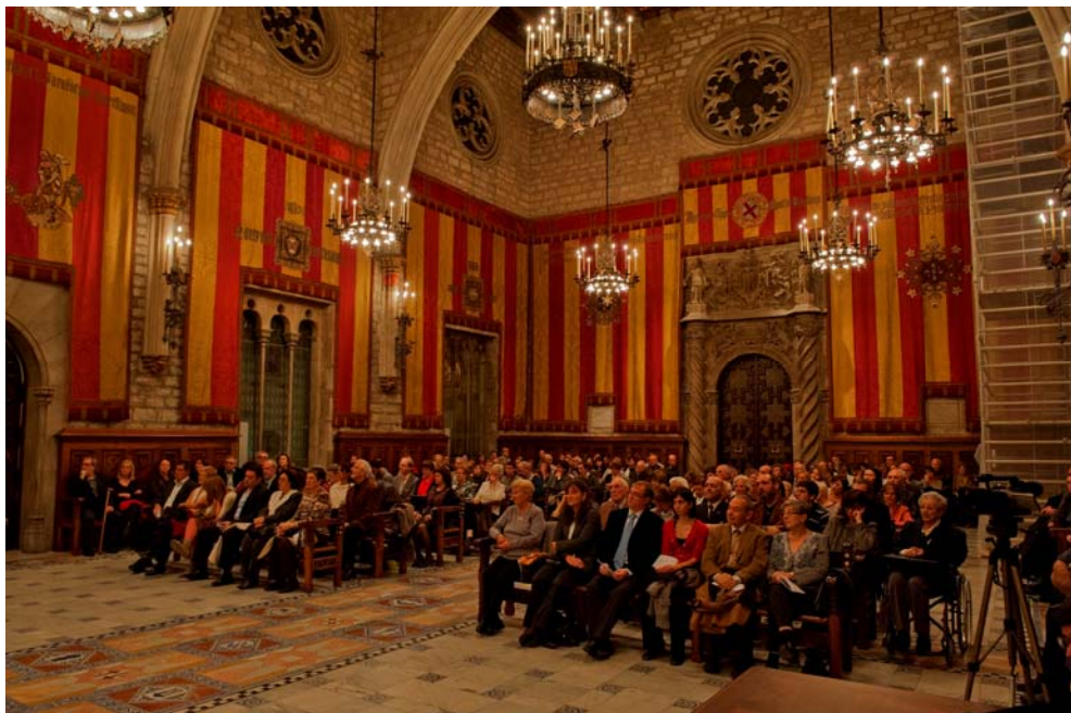
El Saló de Cent durant l'acte de lliurament dels XXIV Premis Josep Maria Batista i Roca